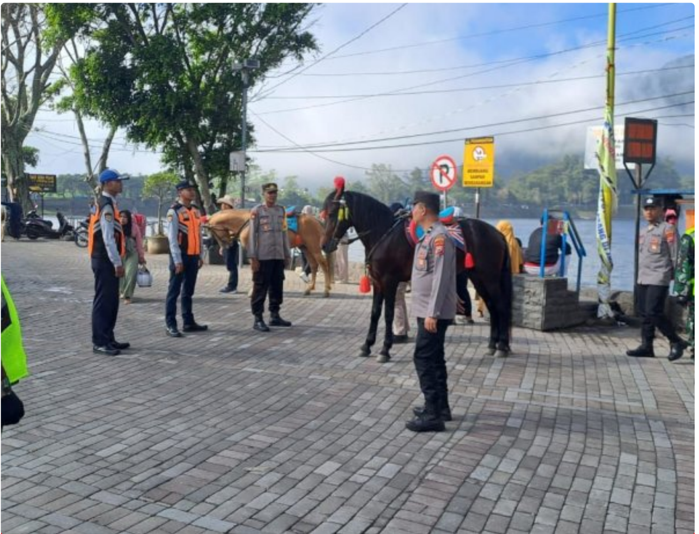
Anggota Koramil 0804/02 Plaosan Ikut Menjaga Pos Pengamanan Nataru di Wilayah Binaan

Magetan. - Anggota Koramil 0804/02 Plaosan bersama Anggota Polsek, Pol PP, Dishub, Puskesmas, dan senkom memantau keamanan dan kondusifitas di tempat wisata, perbatasan di wilayah kecamatan Plaosan dalam rangka Natal