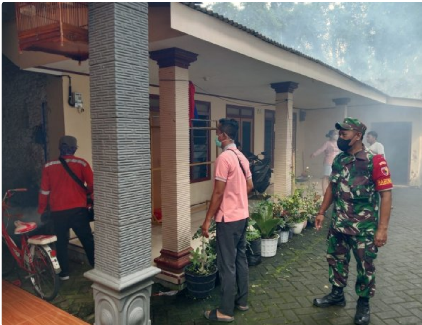
Babinsa Bersama Dinkes Dampingi Fogging, Cegah DBD di Wilayah Desa Binaan

Magetan. Babinsa desa Buluharjo, Koramil Tipe B 0804/02 Plaosan Serka Eko bersama dengan Dinas Kesehatan, Kepala desa Buluharjo dan Perangkat desa melaksanakan antisipasi potensi wabah penyakit demam berdarah akibat dari musim hujan di lokasi pemukiman warga RT 01 s/d RT 03 yaitu dengan cara melakukan fogging atau pengasapan (Pengasapan Pestisida nyamuk) Demam