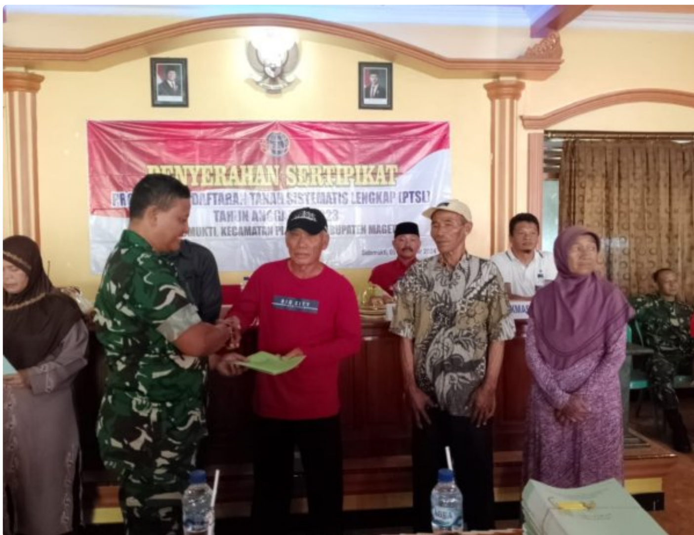
Danramil 0804/02 Plaosan Hadiri Penyerahan Sertifikat Program Pendaftaran Tanah Sistematis Lengkap (PTSL) Desa Sidomukti

PLAOSAN. - Desa Sidomukti melalui Badan Pertanahan Nasional (BPN) melakukan penyerahan Sertifikat Tanah Program Pendaftaran Tanah Sistematis Lengkap (PTSL) di Balai Desa Sidomukti kecamatan Plaosan, Kabupaten