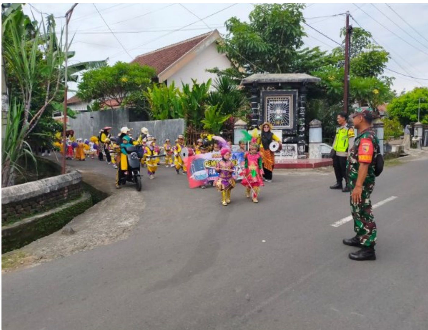
Gebyar Rojabiyah RA dan MI, Babinsa bersama Bhabinkamtibmas Amankan Jalannya Kegiatan Parade Drum Band