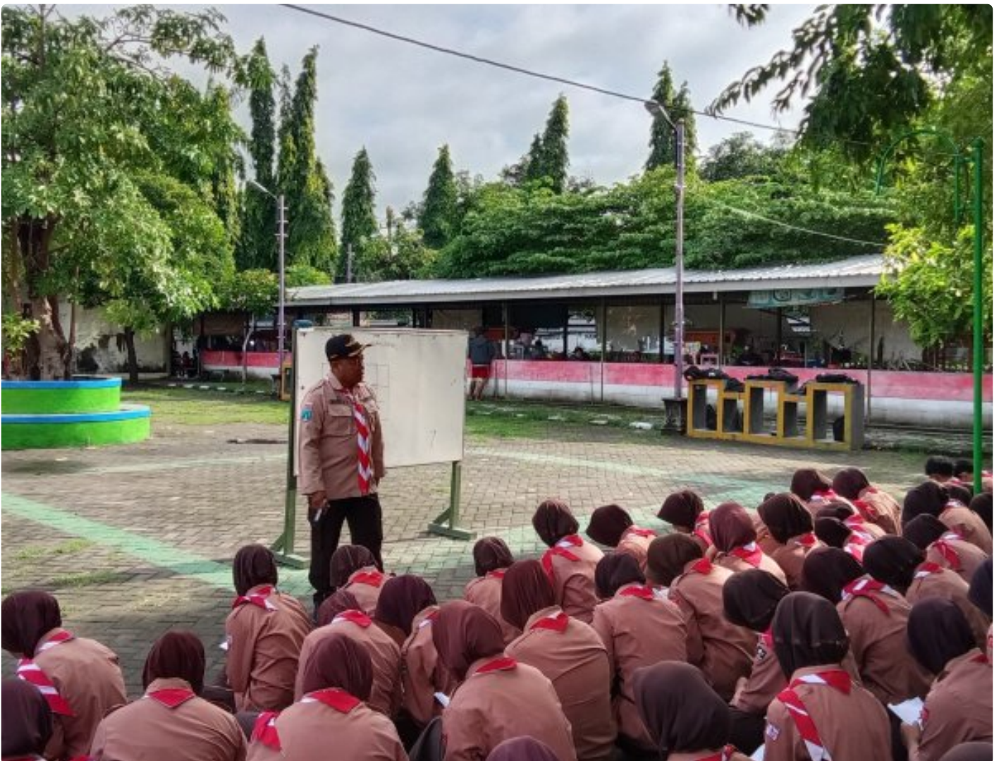
Pramuka Saka Wira Kartika Gelar Kegiatan Mengesan Jejak Untuk Mengasah Keterampilan Anggota

Magetan. Pramuka Saka Wira Kartika Pangkalan Slamet Riyadi Gudup 07.59-07.60 ranting Koramil Tipe B 0804/08 Barat kembali menggelar kegiatan pembinaan dan pelatihan yang bertujuan untuk mengasah keterampilan para